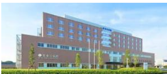
・牧田総合病院蒲田分院リハビリテーション科