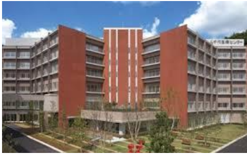
・原宿リハビリテーション病院リハビリテーション科