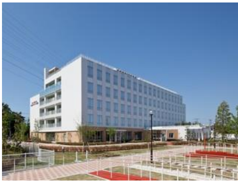
・蒲田リハビリテーション病院リハビリテーション科