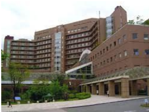
・新東京病院リハビリテーション科