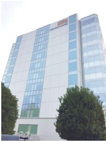
・小金井リハビリテーション病院リハビリテーション科