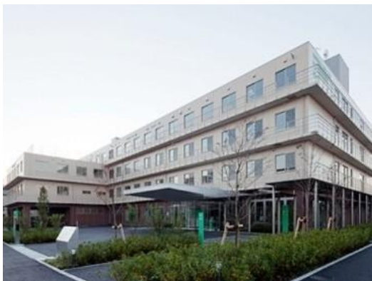
・五反田リハビリテーション病院リハビリテーション科